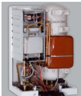
Vitopend 111-W Cazan mural cu boiler încorporat pentru acumularea apei calde menajere